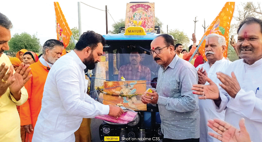
हरिभूमि न्यूज बीना

हनुमान जयंती पर राधे-राधे प्रभात फेरी मंडल द्वारा प्रभात फेरी निकाली गई। जो मां जागेश्वरी धाम से राम धुन के साथ यात्रा प्रारंभ हुई। यात्रा नगर भ्रमण करती हुई गांधी तिराहा से सागर गेट, रेलवे हॉस्पिटल से होते हुई छोटी बजरिया राम मंदिर से